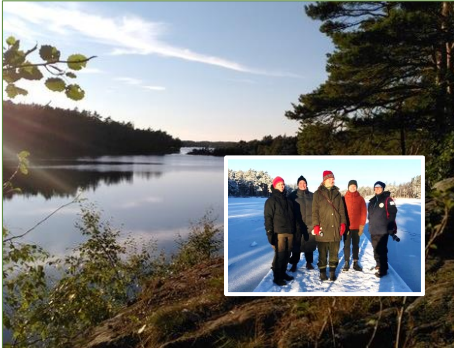
Bakgrundsbild: Surtesjön. Gruppbild: Från besöks- och dialogdagen med Länsstyrelsen, Väst kuststiftelsen och Tikitut community-based tourism 2022.

2023 är här med nya möjligheter att med entusiasm och gemensamma krafter utveckla vårt samarbete och involvera fler parter.