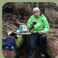
Bengt Scoutkåren Göta Lejon, Trollsjönäs

Värdskap: Roterande värdskap mellan representanterna i rådsgruppen.