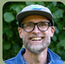
Linus VD Väst kuststiftelsen

”Jag har blivit positiv överraskad av samarbetet Hållbara Vättlefjäll som har lyckats att samla så många olika aktörer från olika samhällssektorer och tre kommuner.”